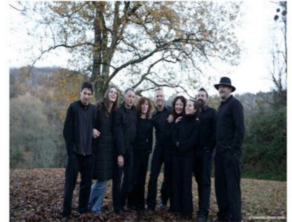
« Le Remède de Fortune »